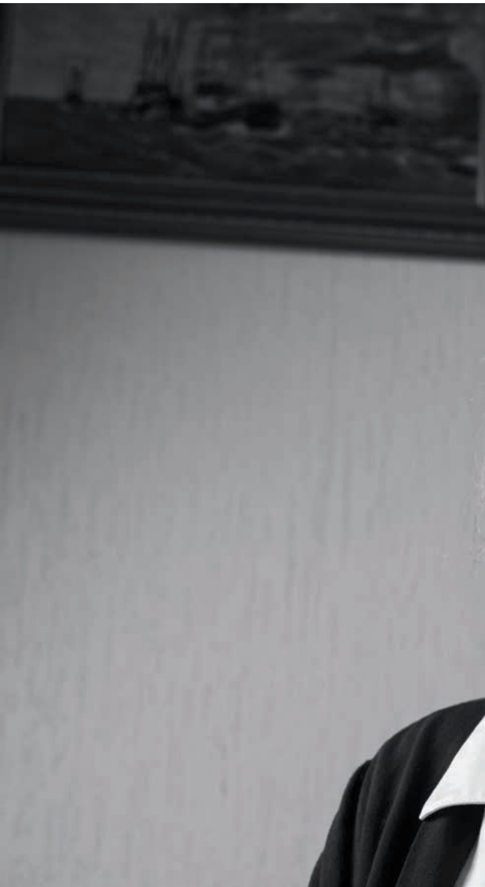
Corrie Keijzer-Molijns 91 jaar