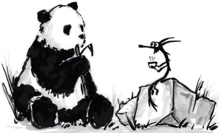
Grote Panda en Kleine Draak.