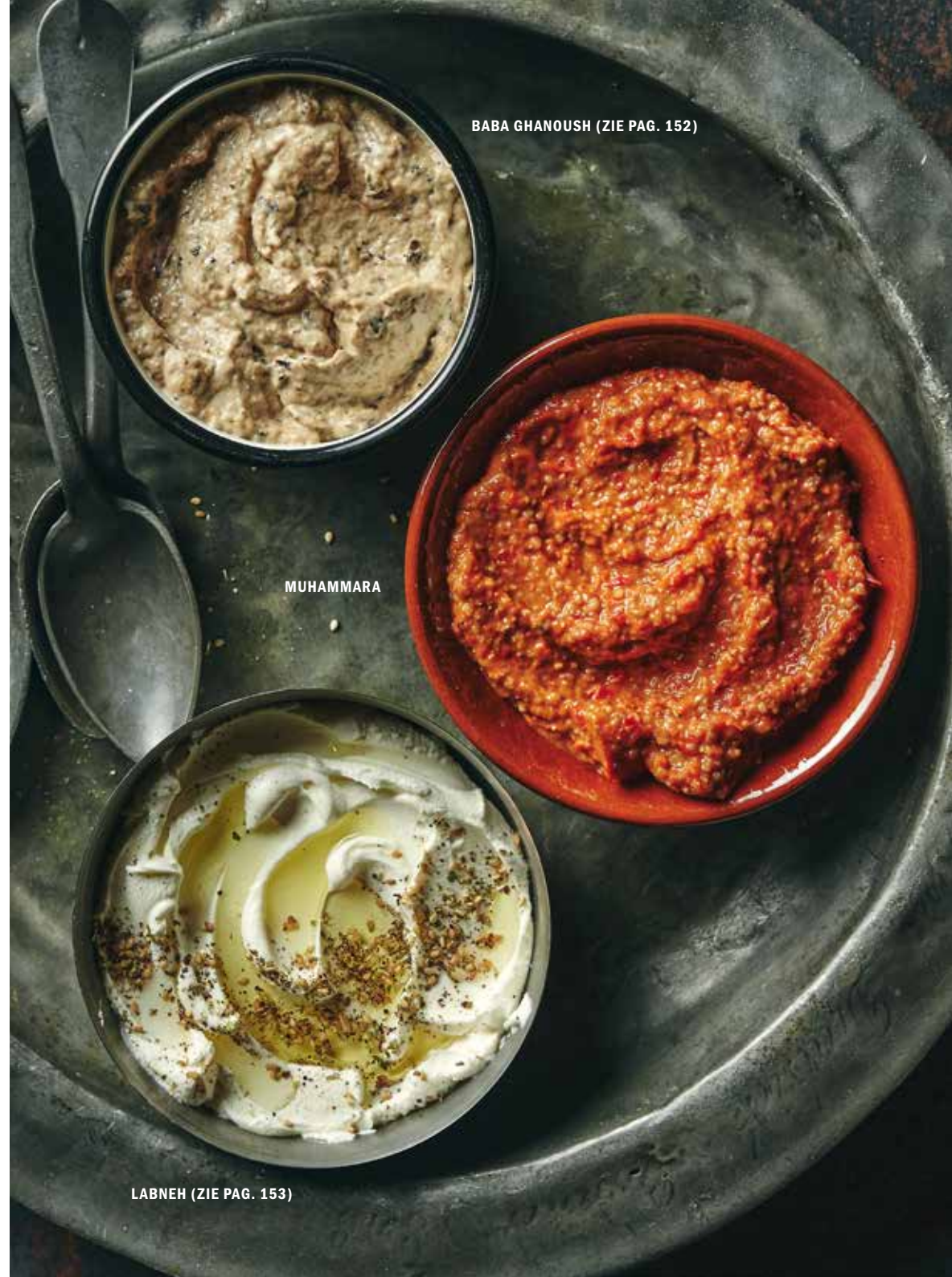
BABA GHANOUSH (ZIE PAG. 152)